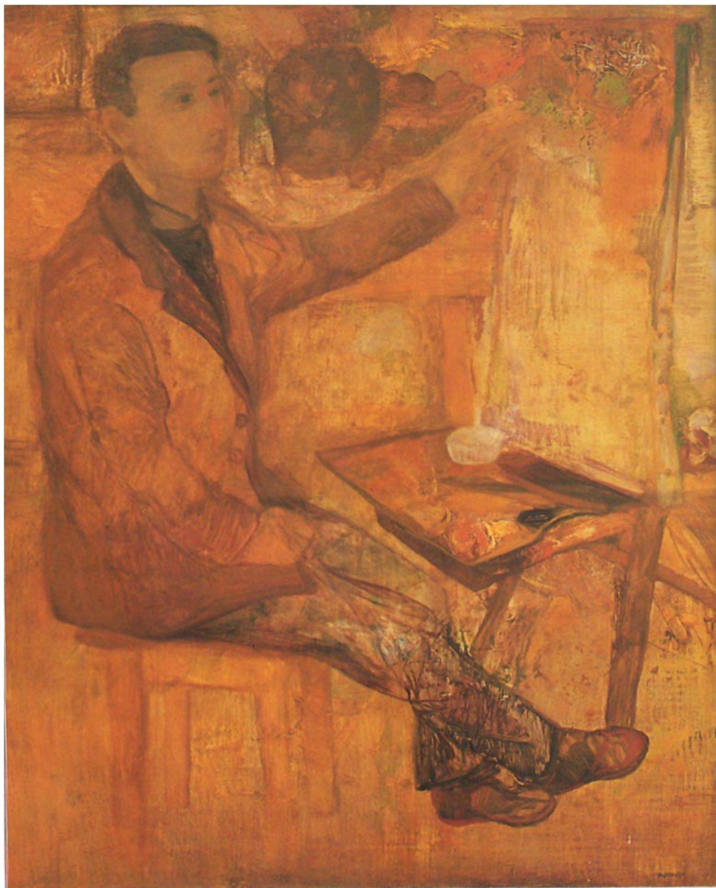
Autoportrait - "A l'Atelier", Huile sur toile, 92 x 73